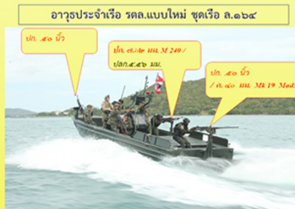
อาวุธประจำเรือ รถล.แบบใหม่ ชุดเรือ ล.๑๖๔